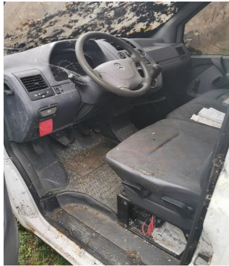
2. Mercedes Vito – unutrašnjost vozila