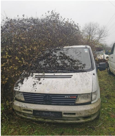
1. Mercedes Vito - prednja strana