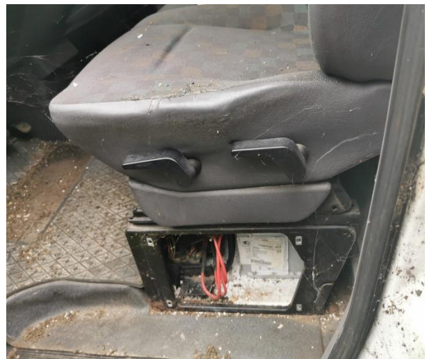
4. Mercedes Vito – unutrašnjost vozila