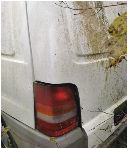
3. Mercedes Vito – oštećenje na vozilu